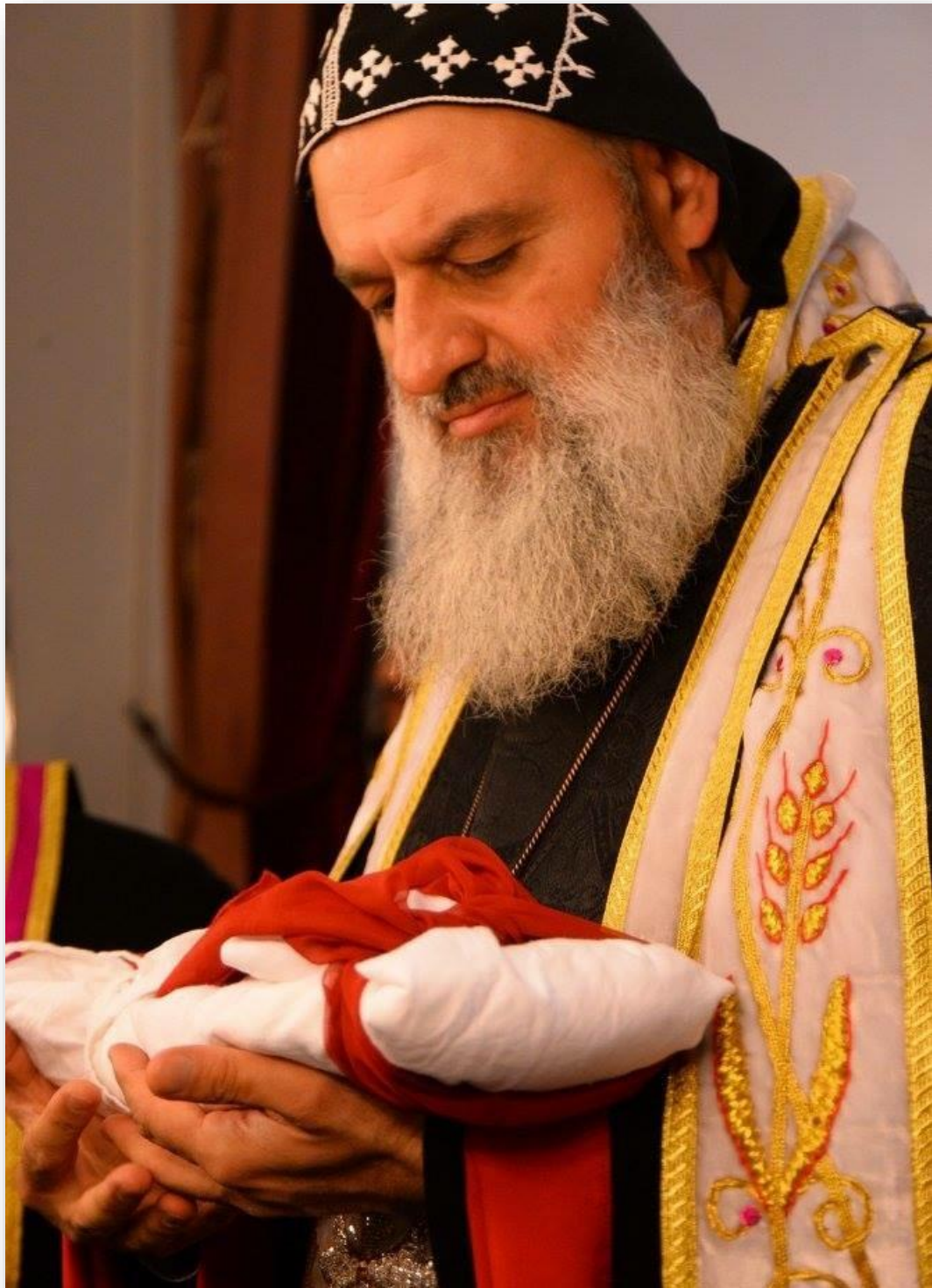
Sua Santidade o Sumo Pontífice Moran Mor Ignatius Efraim II Patriarca de Antioquia e de todo o Oriente e o Chefe Supremo da Igreja Universal Sirian Ortodoxa